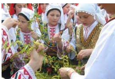
Вярванията като религиозно мислене за отвъдното.